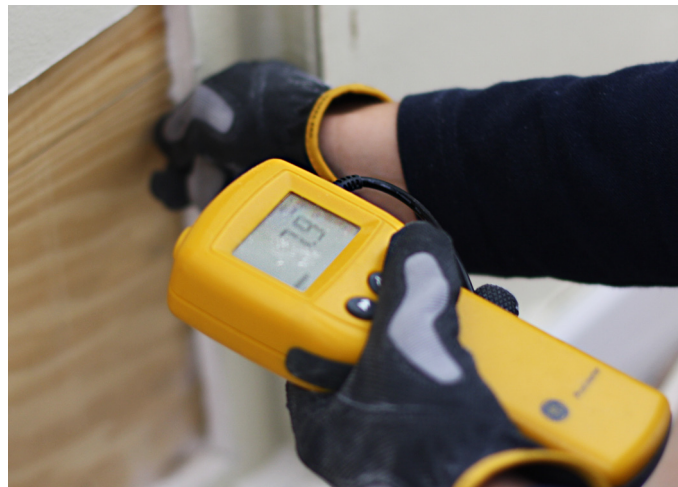
Bild 1. Fuktmätning med Protimeter MMS som mäter fuktkvot i procent.

Vad är då fukt? Normalt brukar fukt bestå av det förångningsbara vatten som finns bundet till materialets porer genom adsorption. Vattnet binds genom kapillärkondensation eller kapillärugning. Men det finns också kemiskt bundet vatten som ingår i materialets struktur och fritt vatten som kan finnas i grova porer